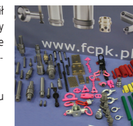
Normalia firmy FCPK Bytów

Zapraszam do lektury raportu oraz do kontaktu z przedstawicielami firm.